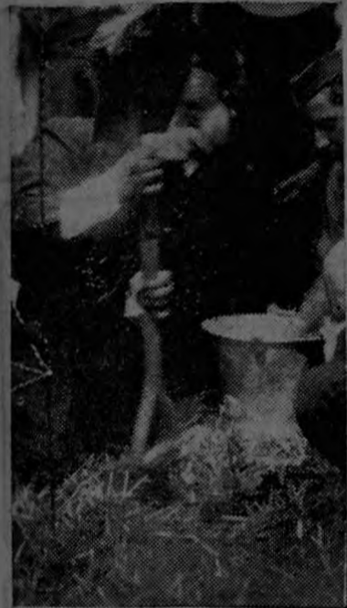
Don José Figueres sembrando un árbol en el parque de Heredia.

La situación del mercado mundial indica que va a haber un sobrante de azúcar y un faltante de café