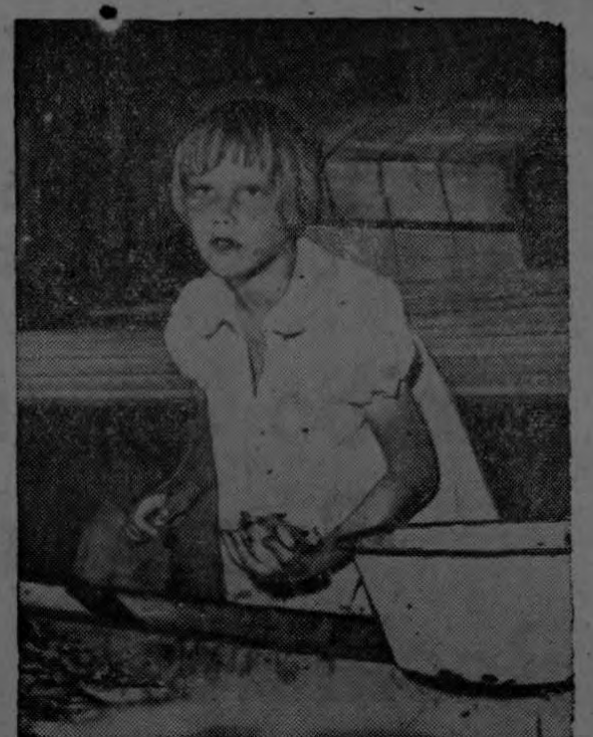
El trabajo de este tipo resulta abrumador para esta niña de seis años. A fin de prevenir la explotación de la niñez, la Organización Internacional del Trabajo de la O.N.U. interviene a favor de leyes contra el trabajo de menores.

Para algunos niños de nuestro mundo obtener un par de zapatos que tal vez ni siquiera son nuevos ni apropiados, es algo inusitado. Y si en el mismo día consiguen