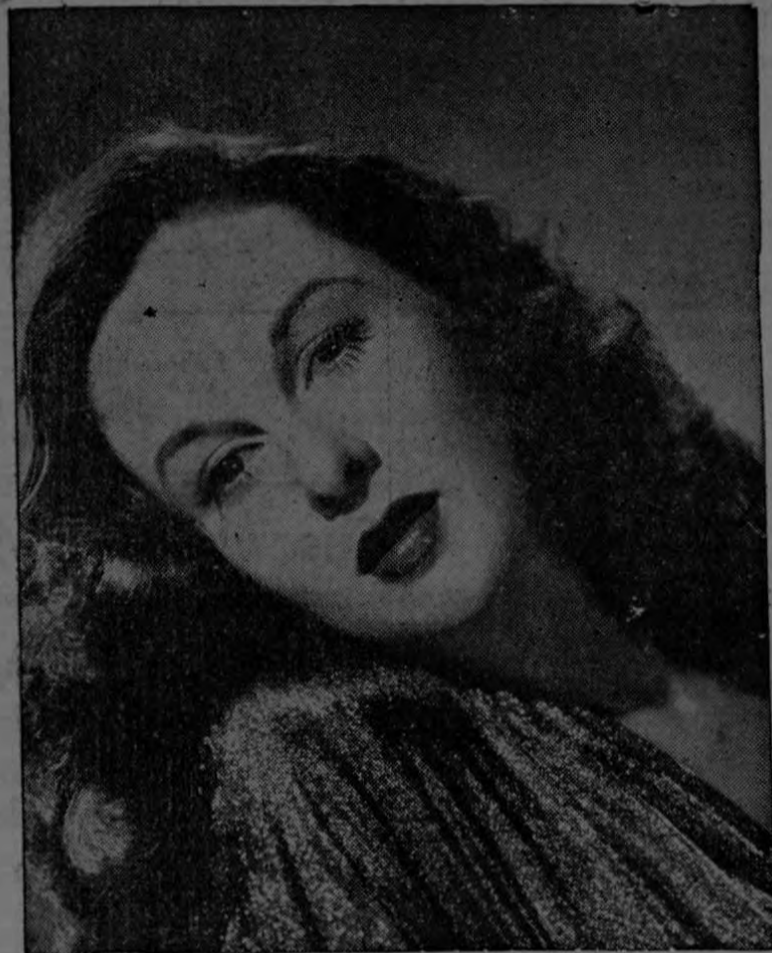
La adorable SUSAN HAYWARD estrella de Universal-International, afirma Max Factor Jr. está convencida de que importante es mantenerse bien maquillada en todo momento y bajo cualquier circunstancia.

Maquillaje Pan Cake y Base de Maquillaje tiene capital importan